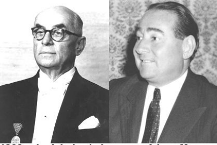
1960 askeri darbesinden sonra Adnan Menderes ve Celal Bayar Anayasa'yı ihlalden suçlu bulunarak idama mahkum oldu. Menderes'in idam cezası infaz edilirken Bayar'ın cezası yaş haddi nedeniyle ömür boyu hapse çevrildi. İzmir'deki havaalanı Menderes'in; Manisa'daki üniversite Bayar'ın adını taşıyor.